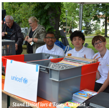
Stand Unicef lors d'Essey Chantant