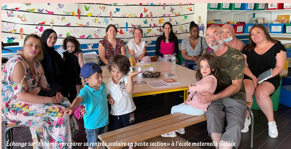
Echange sur le thème « préparer sa rentrée scolaire en petite section » à l'école maternelle Galilée

L'entrée à l'école maternelle est une étape importante dans la vie des tout-petits, qui soulève bien des inquiétudes. Pour aider les familles à passer le cap plus sereinement, la ville d'Essey-lès-Nancy mais aussi les écoles et les crèches de la commune, ont mis en place différentes actions.