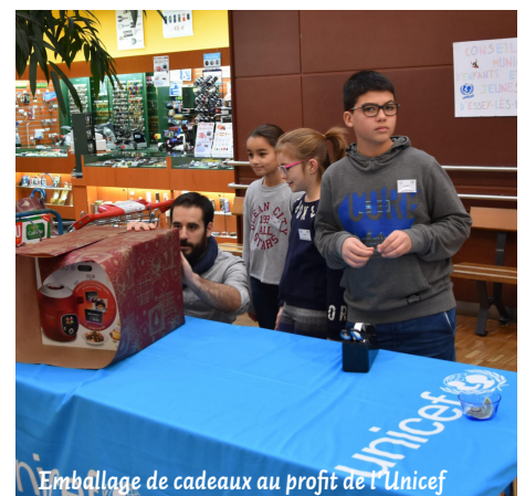
Emballage de cadeaux au profit de l'Unicef