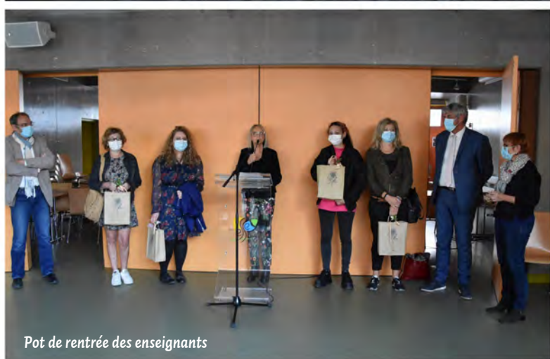
Pot de rentrée des enseignants