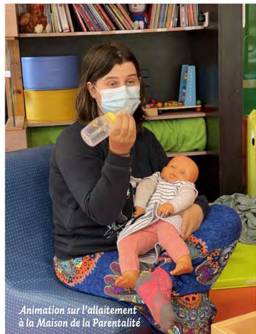
Animation sur l'allaitement à la Maison de la Parentalité