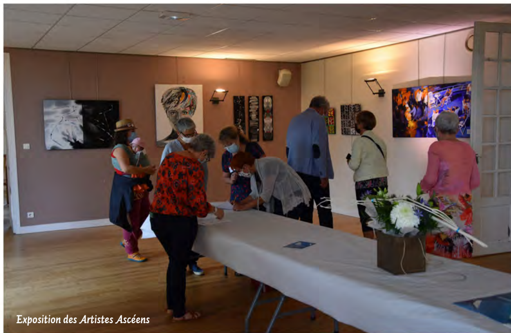
Exposition des Artistes Ascéens