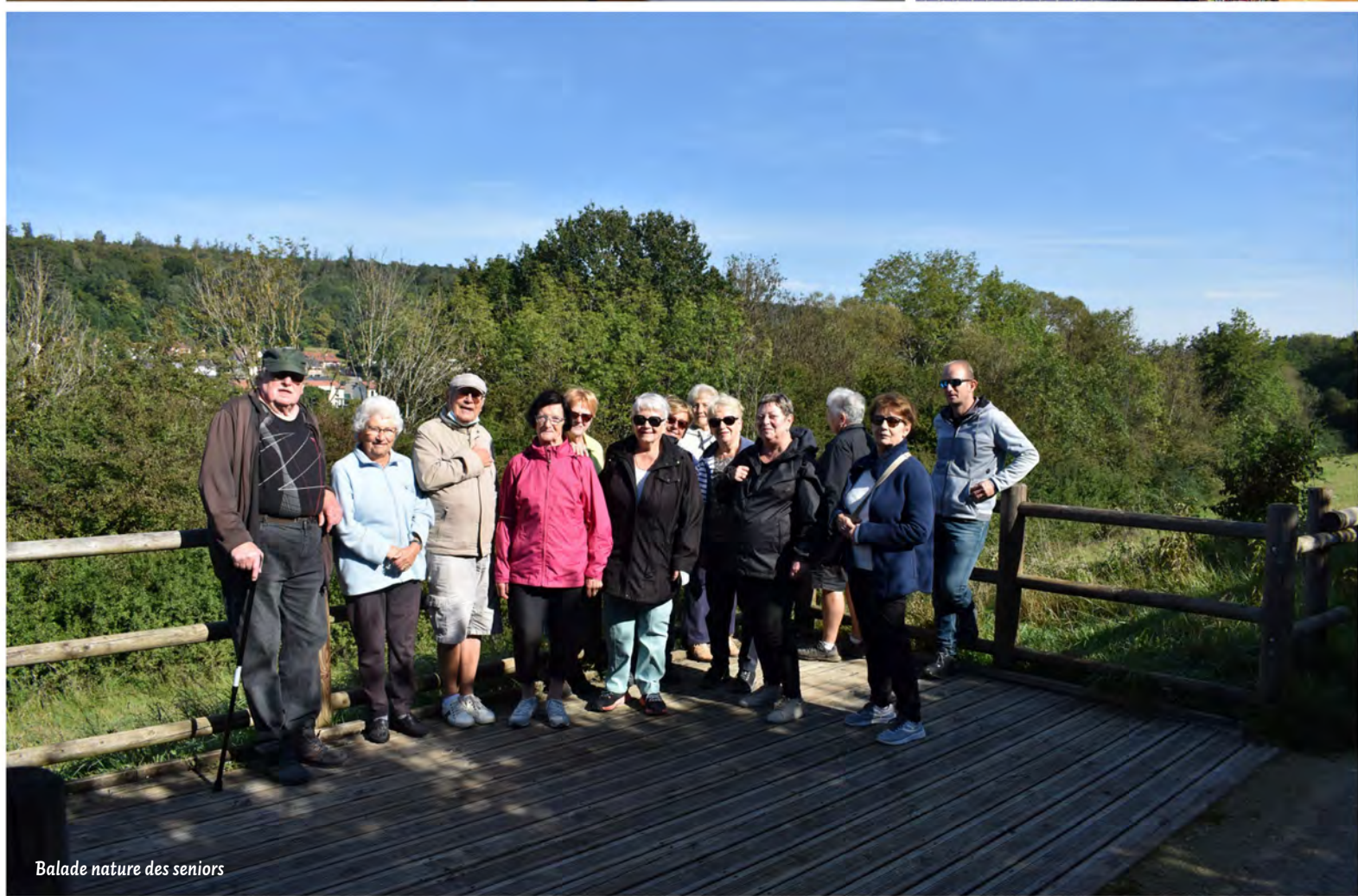
Balade nature des seniors