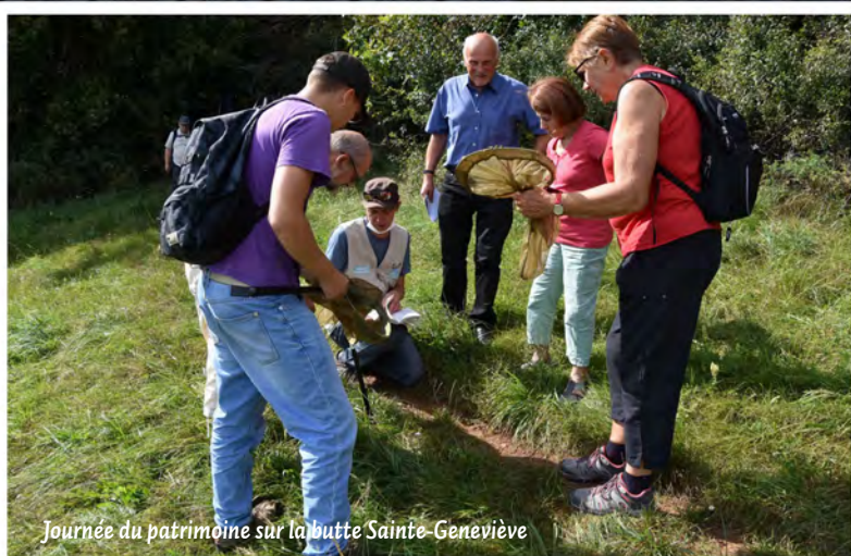
Journée du patrimoine sur la butte Sainte-Geneviève