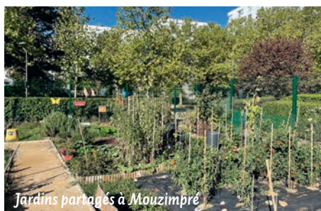
Jardins partagés à Mouzimpré