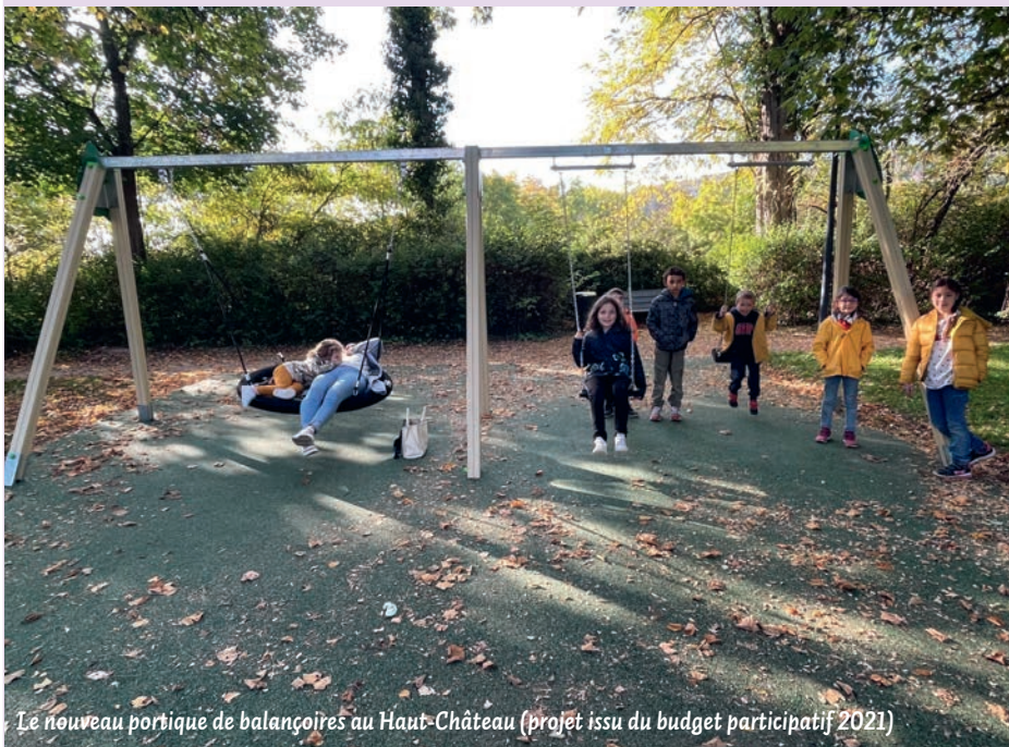
Le nouveau portique de balançoires au Haut-Château (projet issu du budget participatif 2021)

Les Ascéens étaient invités à déposer leurs projets pour l'édition 2022 du budget participatif sur la plateforme en ligne, du 1 er juin au 31 août.