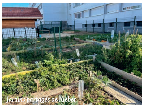
Jardins partagés de Kléber