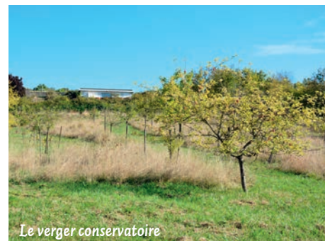
Le verger conservatoire

La Ville pratique le fauchage tardif dans ses parcs depuis plusieurs années. Il s'agit concrètement de laisser pousser l'herbe et les fleurs sauvages dans les endroits où cela n'entraîne pas de problème de sécurité. Le fauchage est effectué une fois que l'herbe et les fleurs sont fanées, ce qui permet également aux plantes de monter en graines pour une repousse l'année suivante. Pratiquer le fauchage tardif, c'est aussi agir pour la biodiversité en laissant à la nature le temps de développer des zones refuges pour les petits animaux et les insectes pollinisateurs. La survie de bien des espèces de plantes est ainsi préservée.