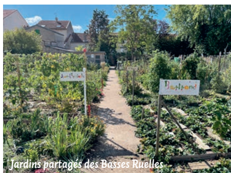
Jardins partagés des Basses Ruelles