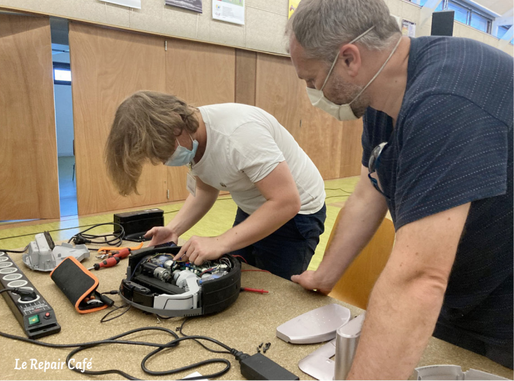
Le Repair Café