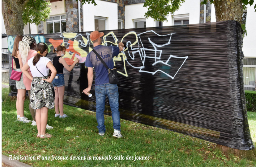
Réalisation d'une fresque devant la nouvelle salle des jeunes