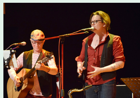
Un jeudi de la culture avec le concert celtique de "Grand Large"

Dès la rentrée de septembre, le comité de pilotage s'emploiera à construire la 25 e édition de ce grand rendez-vous. À n'en point douter, pour le plus grand plaisir des Ascéens !