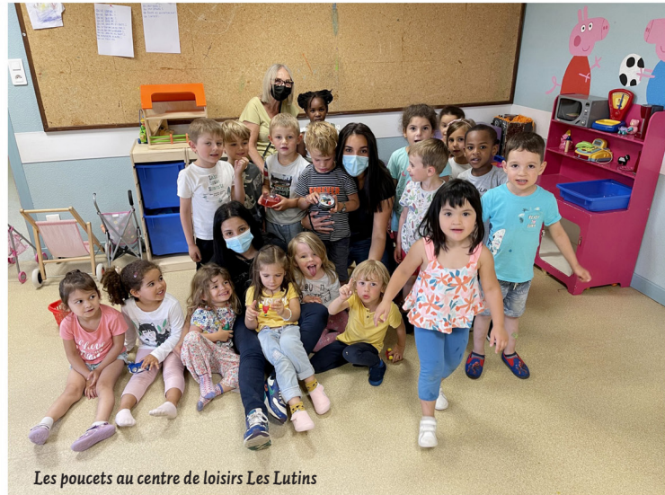
Les poucets au centre de loisirs Les Lutins