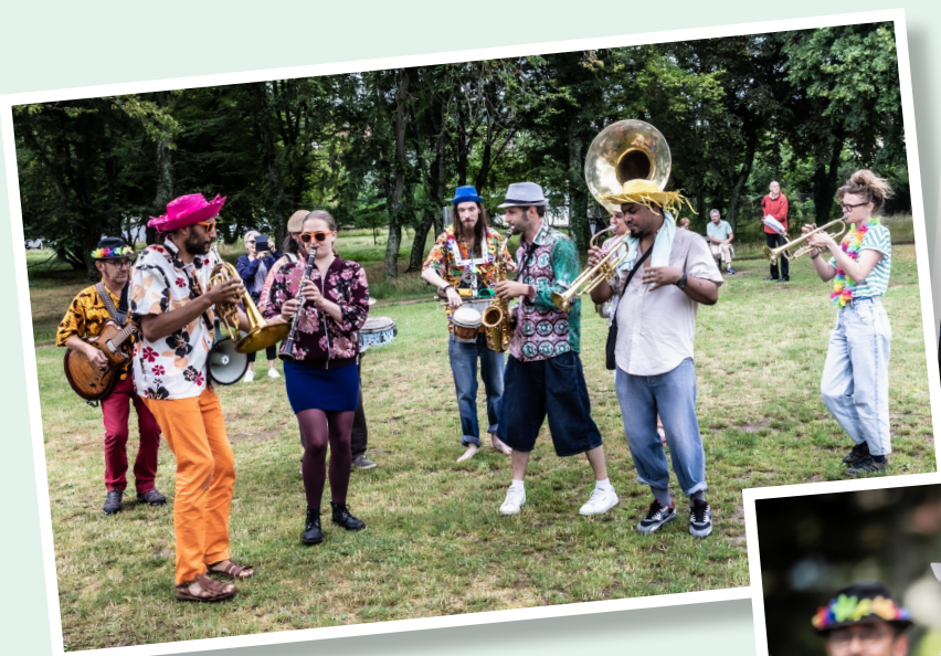
La fanfare Mova Bunda

De la musique, de l'enthousiasme, de la convivialité, de la bonne humeur et du bonheur ! Voilà les mots-clés qui résument ce qu'ont vécu les spectateurs, artistes et organisateurs réunis le 4 juillet dernier pour l'édition 2021 d' « Essey Chantant », une édition très attendue et parfaitement réussie. Des plus petits aux plus grands, il y en a eu pour tous les âges et pour tous les goûts ! La preuve en images grâce aux superbes photographies de Sylvain Schorr.