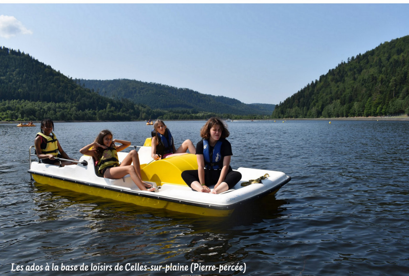
Les ados à la base de loisirs de Celles-sur-plaine (Pierre-percée)