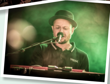
La Casa Bancale