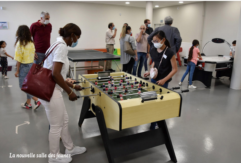
La nouvelle salle des jeunes